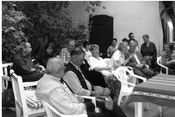
Böhmische Märchen und Geschichten am Böhmischen Schulhaus. Wie überall trafen sich ganz unterschiedliche Menschen beim Zuhören.