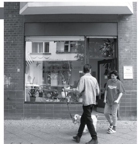
Die Physiotherapeutin ist mit den Nachbarn gut bekannt.

Und schon klopft eine Kiezfreundin an, um die Massage für nächste Woche zu verabreden. Dann stürmt der fast erwachsene Sohn