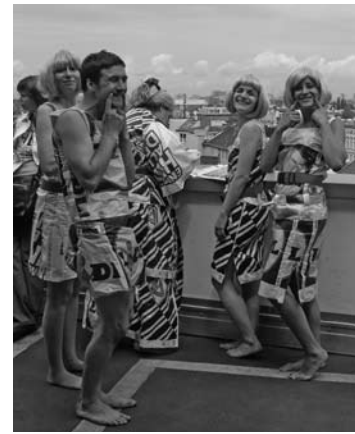
Im Lidl- und Aldikostüm: Mit Ironie nahmen die Tänzer/innen von „Brace survival kit performance“ die Situation bei den Discountern aufs Korn (hier auf dem Dach der Neukölln-Arkaden) bei 48 Stunden Neukölln