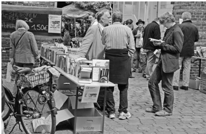
Sprach- und Lesewochen Neukölln Futter für Bücherwürmer gab es reichlich am 18. Mai: hier am Stand der Bürgerstiftung Neukölln in der Villa Rixdorf beim Auftaktfest