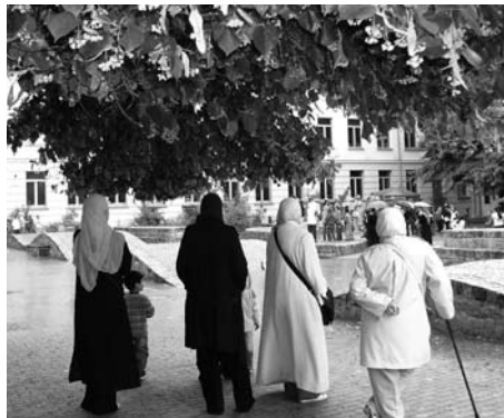
Aufmerksam verfolgten die Mütter beim Hoffest der Richard-Grundschule am 13. Juni die Darbietungen der Schüler. Die Mütter hatten ihrerseits mit selbst gebackenen Leckereien zum Gelingen des Festes beigetragen. Da ließ sich niemand von den Regentropfen, die zwischendurch fielen, die gute Laune verderben.