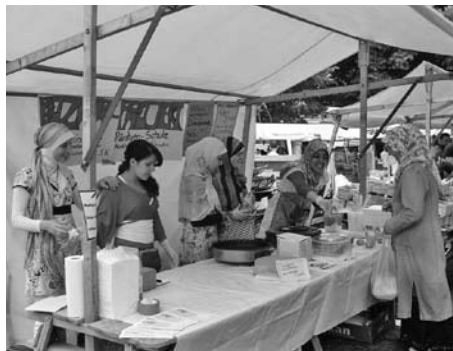
Schülerinnen der Röntgen-Oberschule bieten jeden Mittwoch auf dem Markt am Karl-Marx-Platz einen frischen Imbiss an