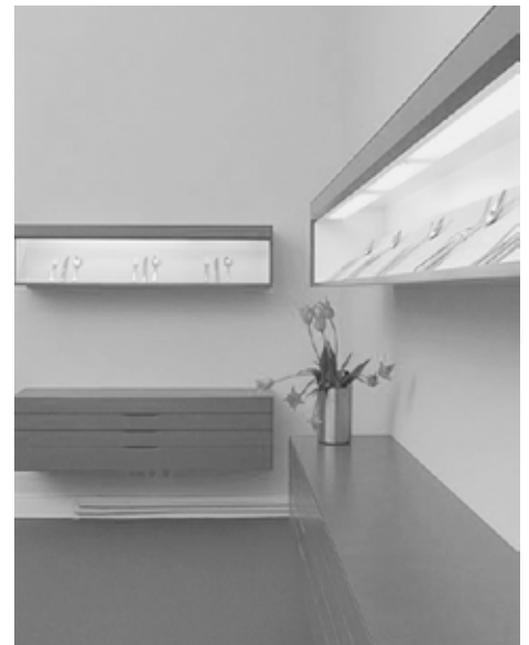
Besucher sind willkommen!

Das hier ist eine Insel, etwas ganz Beson-