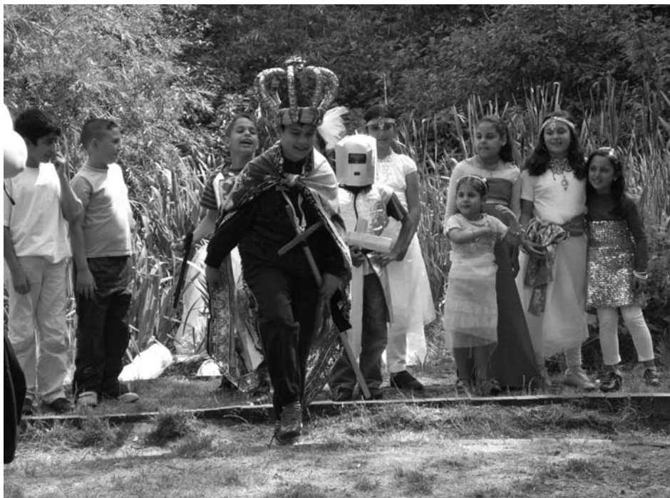
Die Streuobstwiese am Richardplatz 3 war bereits in diesem Sommer Schauplatz verschiedener kultureller Veranstaltungen: Hier spielten Kinder aus der Nachbarschaft Theater, es wurde gelesen und diskutiert.