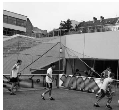
Fußball bedeutet auch, Regeln akzeptieren zu lernen: Hier auf dem Droryplatz an der Löwenzahn-Schule

Duldung, Aufenthaltstitel, Niederlassungs-erlaubnis... Wer mehr wissen will, kann sich an eine der Beratungsstellen wenden.