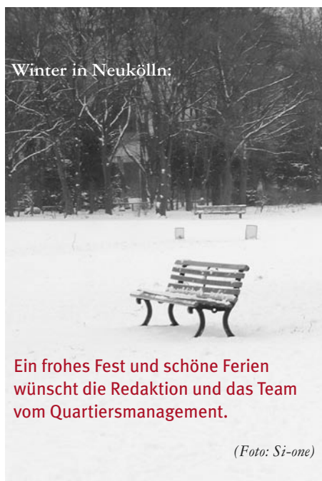
Winter in Neukölln:

Initiatoren: Quartiersmanagement, Zwischennutzungsagentur und Si-one