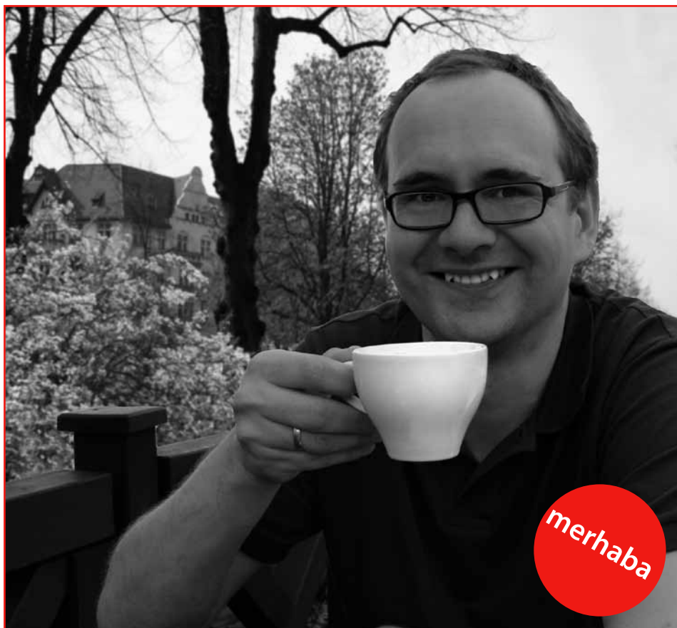
Glückliche Momente erlebt jeder anders - ihm scheint es ganz gut zu gehen