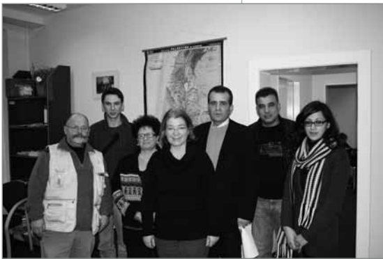
Das Team des DAZ freut sich über Ihren Besuch

Uthmannstr. 23, 12043 Berlin Tel.: 030 - 568 266 48 E-Mail: daz@ejf.de Weitere Informationen: www.ejf.de/einrichtungen/kinder-und-jugendhilfe/deutsch-arabisches-zentrum.html