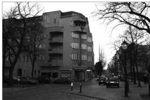
Wohngebäude am Richardplatz

In der Folge bedeutet dies, dass es im unteren Wohnungsmarktsegment keine Entspannung geben kann, weil Einkommensstärkere ebenfalls in dieses Segment reindrängen. In diesem Fall richteten sich die Menschen die Wohnungen zum Teil selbst her und bleiben zu günstigen Mieten in den Wohnungen. In Berlin herrscht zudem die Tendenz, dass die jungen Menschen, die den größten Teil der Zuwanderer nach Berlin stellen, überwiegend in die einst günstigeren Innenstadtbirke ziehen.