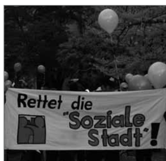
Protestaktion vor dem Ministerium

Hierbei ersetzt Berlin 2011 zu 100% die vom Bund gekürzten Städtebauförderungsmittel und sichert somit den breiten und integrativen Förderansatz des Berliner Quartiersmanagements. Die Bezirke und Förderstellen sowie die