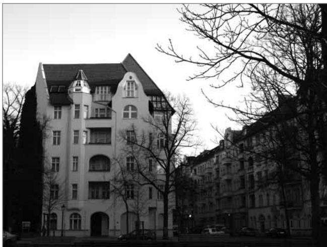
Architektur zum Beeindrucken: Gründerzeitbau am Richardplatz

Wie Sie ja wissen, haben wir letzten Sommer die Entwicklung im Quartiersmanagement-Gebiet Richardplatz Süd untersucht. Aktuell führen wir eine ähnliche Untersuchung im Ganghoferkiez durch. Was wir feststellen ist, dass die Mieten steigen, wie ja schon erwähnt auch in Berlin insgesamt. Zugleich kommen mehr Studenten nach Neukölln, was wir aber eher positiv sehen, denn gerade der Zuzug der eher einkommensschwachen Studenten führt zu einer Stabilisierung des Stadtteils, weil sie für mehr Mischung sorgen. Dennoch, auch dies stimmt mit unseren Berliner Erfahrungen überein, der Druck und die Konkurrenz im unteren Marktsegment nehmen zu.