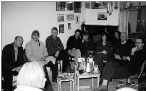
Treffen der Gewerberunde bei Gönül's Art in der Wipper Str.

Das Projekt wurde vom Quartiersmanagement Richardplatz Süd aus Mitteln des Programms "Soziale Stadt" finanziert. Im Jahr 2010: 15.000, Euro