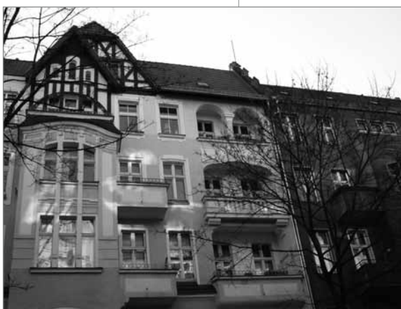
Die einen bekommen einen frischen Anstrich, die anderen nicht

Wohnungsbau-Gesellschaften aus dem städtischen Besitz zu verstehen. Wenngleich auch heute das Wohnen in einer Wohnung einer großen Wohnungsbau-Gesellschaft immer noch eine Alternative zum gänzlich freien Wohnungsmarkt sein kann.