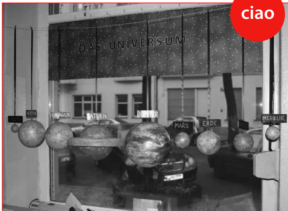
Das Universum in Neukölln. Gefunden in der Kita „Pimperle“, Niemetzstraße 11