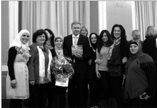
Die „Berliner Tulpe“ vom Regierenden Bürgermeister überreicht