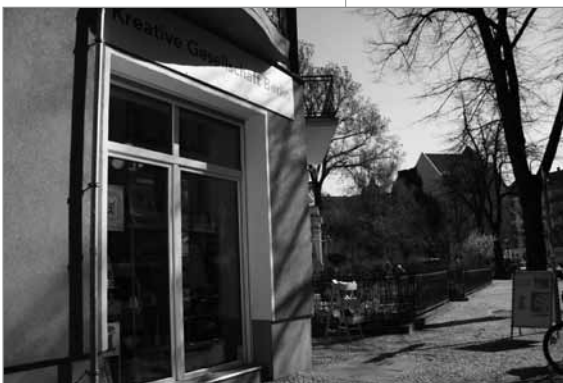
Helle Räume laden zum Verweilen ein

insgesamt schon stärker reglementierten Spielhallen“, fasst der Amtsleiter zusammen. Dabei ist die Praxis der Gastronomiebetriebe, bei denen es sich oft um „genehmigungsfreie Cafés ohne Alkoholausschank“ handelt, sich selbst ‚Casino‘ zu nennen etwas irreführend. Für die meisten Gaststätten ist es grundsätzlich unproblematisch, je nach Größe,