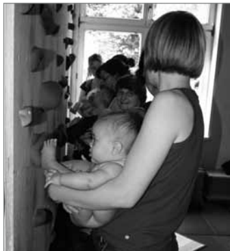
Familienbildung fängt früh an

In seiner elften Sitzung ging es vorrangig um ein Resümee und die Perspektiven der Arbeit des Quartiersrates sowie die Abstimmung über fünf Projektideen für den Quartiersfonds 2. Das QM-Team berichtete zu Beginn über verschiedene aktuelle Entwicklungen. So informierte es darüber, dass die Kürzungen der Bundesmittel für das Programm „soziale Stadt“ durch eine Aufstockung der Mittel des Landes Berlin 2011 voll ausgeglichen werden. Damit sind die ursprünglich erwarteten Fördermittel für das Programmjahr 2011 gesichert. Im Folgenden befassten sich die Anwesenden mit einem Resümee und den Perspektiven ihrer Arbeit im Quartiersrat. Insbesondere mangelnde Möglichkeiten der Einflussnahme, geringe Effizienz sowie ein zu formalisiertes Vorgehen sorgten bei einigen Quartiersratsmitgliedern für Unmut. Sie wünschten sich vor allem mehr Lebendigkeit und Praxisbezug in der Quartiersratsarbeit. Für die Zukunft wurden eine verstärkte Arbeit in Arbeitsgruppen, Projektpatenschaften, bei denen Quartiersratsmitglieder einzelne Projekte begleiten, sowie die Teilnahme an Projektevaluationen vorgeschlagen.