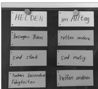
Helden im Alltag gesucht und gefunden