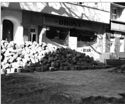
Umbaumaßnahmen in Neukölln nicht NY

Gerade die Spielstätten und Wettbüros werden nicht mehr nur als eine Gefährdung für Jugendliche und Spielsüchtige wahrgenommen. Die einen stören sich an der Aufmachung der einschlägigen Geschäfte, die anderen vermuten, dass die Automatencasinos die organisierte Kriminalität anzieht. Aber es gibt noch eine wesentliche Dimension: „Für mich ist es einfach eine Belästigung. Mal sind es lärmende Besucher der Spielhalle, dann gibt es wieder lautstarken Streit, eimerweise Zigarettenkippen und zuletzt sogar Einbrüche und Sachbeschädigung“, beschwert sich eine Anwohnerin bei der Redaktion. Mittlerweile überlegt sie sich, ob sie nicht sogar aus der Gegend wegzieht. Sie, wie auch etliche ihrer gestressten Nachbarn, wünscht sich mehr staatliches Eingreifen. „Ich kann die Anliegen der Anwohner gut nachvollziehen“, stimmt Kalusa den Beschwerden der Bewohner zu, jedoch würden viele Bürger die Aufgaben und vor allem die Möglichkeiten des Ordnungsamtes überschätzen, „das kann schon frustrierend sein, für beide Seiten“, wirbt Kalusa um Einsicht. „Wie beschrie-