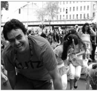
Spaß haben ist wichtig und steckt an