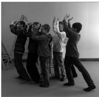
Unterstützung lässt sich üben