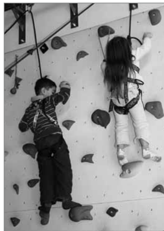
Klettern für Kitakinder geht weiter!