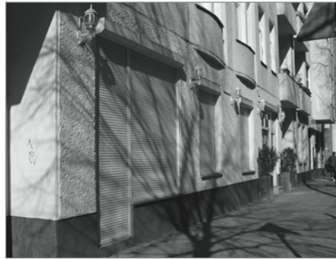
Offiziell werden nur Zimmer vermietet

Standorten. Hier sind 500 Meter vorgesehen, und die Betriebe dürfen „nicht in räumlicher Nähe zu vorwiegend von Kindern und Jugendlichen aufgesuchten Einrichtungen“ entstehen, jedoch ist bei den 500 Metern nicht klar, ob es sich dabei um eine Wegstrecke für Fußgänger oder Autofahrer oder Luftlinie handelt. Letztlich ist es in der Hand der Vermieter, wen sie als Mieter in ihr Gebäude lassen. Hier haben sich kurzfristig die Automatencafés als zahlungskräftige Gewerbemieter gefunden. „Für den Richardkiez ist das eine un schöne Entwicklung“ meint die Anwohnerin. Am besten sei es, wenn der Vermieter selbst im Haus wohnt, denn so die engagierte Frau: „die würden sich das nicht selbst antun.“