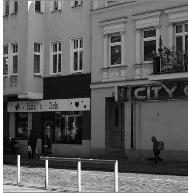
Die Konzentration einzelner Gewerbe ist nicht zu übersehen

Andererseits entsteht der Eindruck, dass die Anzahl von Vergnügungstätten in Gestalt von Spielhallen, Wettbüros oder Bordelle sehr stark zunimmt. Heute werden die Quartiersmanagerinnen immer häufiger von Bewohnern um Hilfe gebeten, die sich aufgrund von Lärm, Verschmutzung oder Streitereien belästigt fühlen. In der Sonnenallee und der Karl-Marx-Straße gehören sie schon lange zum Straßenbild, aber auch in der Braunschweiger Straße, der Wipper Straße oder am Karl-Marx-Platz scheinen Spielcasinos, Wettbüros und Anbieter von käuflichem Sex ihre Geschäftsräume zu etablieren.