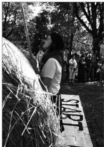
Es kann wieder gerollt werden: 10.09.2011