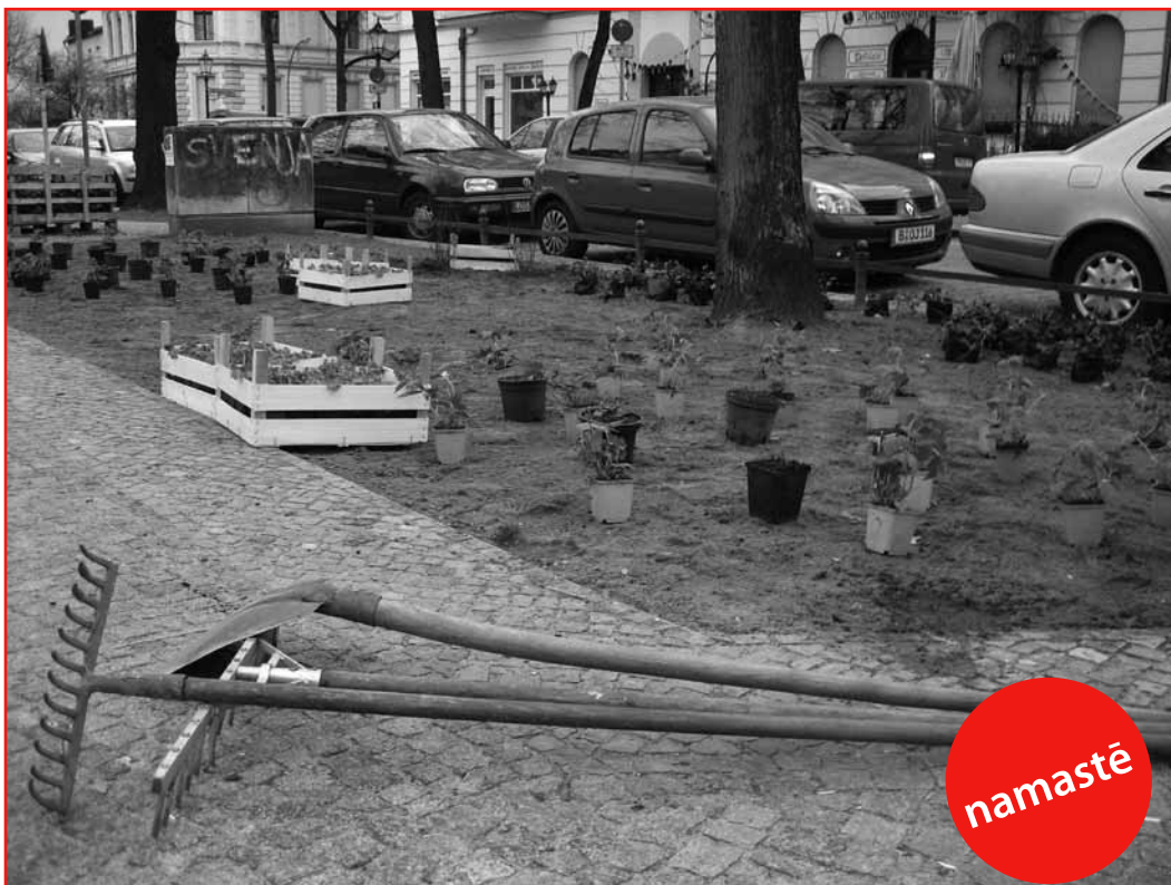
Am Richardplatz wird gepflanzt, bald sehen wir die Ergebnisse