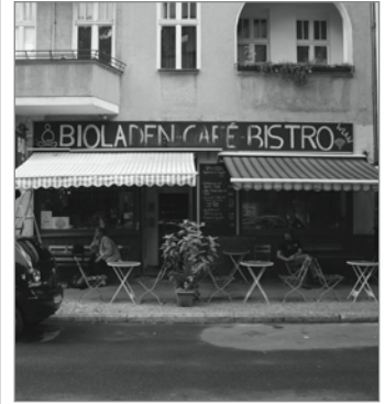
Entgegen aller Unkenrufe: Bio ist da!