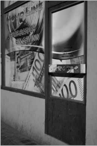
Es lockt, das vermeintliche schnelle Geld

Das Quartier Richardplatz Süd hat sich in den letzten Jahren zunehmend verändert. Beobachtbar sind unter anderen zwei unterschiedliche Entwicklungen in der Gewerbestruktur. Einerseits eröffnen neue Cafés, Bars und Kulturorte wie der Bioladen 'Kleiner Buddha', die Kneipe 'B-Lage', das Café 'Geschwister Nothhaft', die Schmuckdesignerin SNOU oder die Galerie Savy Contemporary Art, die Kulturleute vom KGB 44, der Salon Tippelt und neuerdings auch noch die Kulturmacher. Diese Dynamik wurde sicherlich auch durch die Ansiedelung von Gewerbetreibenden im Rahmen des fünf Jahre laufenden Projekts „Gewerbeleerstand als Ressource“ angeschoben. Denn 2005 gab es im Kiez noch circa 90 leer stehende Gewerbeeinheiten.