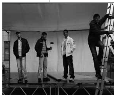
Das Team für die mobile Bühne