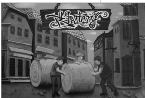
Ein eindrucksvolles Ergebnis: Das Graffiti an der Schmiede

Projektvolumen: Das Projekt wird im Jahr 2011 aus Mitteln des Programm „Soziale Stadt“ mit 40.000 Euro gefördert.