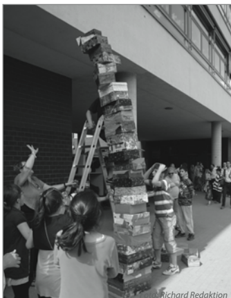
Aufbauleistung ganz praktisch