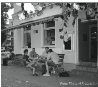
Biertrinken und Schach spielen, das geht

Zatopek: Café/Bar, Niemetzstr. 24, 12055 Berlin, Di- bis Sonntag: ab 15:00 www.zatopek-berlin.de