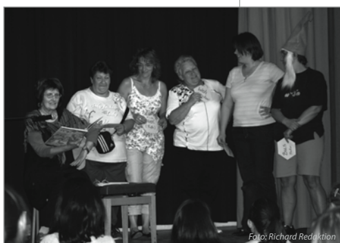
Hier müssen alle ran: Geräuschimprovisation

Eigentlich war es eine Lesung für Kinder, über Zwerge und Riesen. An einem sonnigen Freitagnachmittag am Droryplatz. Der Raum wird dunkel bis auf ein Licht auf der Bühne, ein paar Bücher, eine Vase auf dem kleinen Tisch und einem Stuhl.