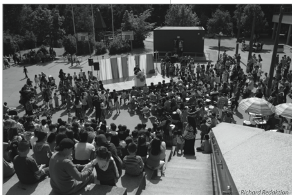
Die Eröffnung des „Wir-Fest“ ist ein voller Erfolg

Frau Hoppe, die Schulleiterin, führte in vielen Diskussionsrunden die Probleme, die sich aufgrund der Mehrfachnutzung des Droryplatzes ergeben, aus. Heute führt sie heiter durch das „Wir-Programm“. Ein Motto, das den Worten auch Taten folgen lässt. Das Bezirksamt hat schnelle Hilfe zugesagt, es soll mehr Personal für die Betreuung des Platzes am Wochenende geben. Die Kinder erarbeiteten gemeinsam mit der Schulstation Pustebblume fünf Regeln für den gemeinsamen Umgang (siehe Kasten). „Das sind jetzt unsere Regeln“, sagt Melissa mit Stolz in der Stimme. Den gemeinsamen Umgang auch nach der Schule zu pflegen, sieht Carmela Szafraniec, langjährige Mitarbeiterin am Pavillon, als eine wesentliche Aufgabe. Die Angebote sind dabei flexibel. Die Gruppentreffen und Kurse finden sowohl im Kinderpavillon als auch in den Räumen der Löwenzahn-Grundschule und der Sporthalle statt. Wichtig ist, dass bei aller Feierlaune die Probleme nicht kleingeredet werden. „Leider sind wir manchmal schon zu sehr `up-to-date`, denn mit unseren Internet Workshops für Eltern „Cyber Mobbing“ wie schütze ich mein Kind? und den Computer Workshops für Kinder „Net-Compass“ und „Wie schütze ich mich selber?“, liegen wir gerade voll im Trend“, fasst Claudia Israel die tägliche Arbeit zusammen. Jetzt steht aber als nächstes Projekt die Gestaltung des Sommerferienprogramms an. Miteinander etwas machen, zeigt das Fest, ist sowieso die beste Art, Gemeinsamkeit zu pflegen..