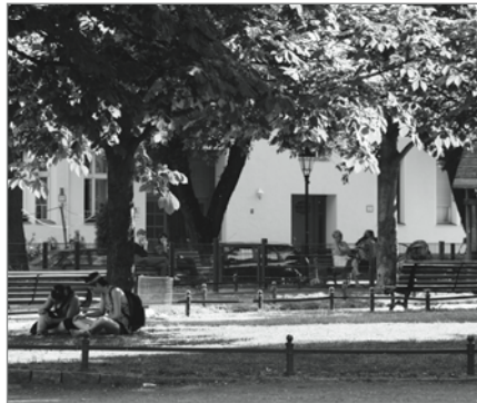
Die Bäume am Richardplatz spenden Schatten

Auf dem neu gestalteten Richardplatz sitzen jüngere und ältere Menschen auf den Bänken und plaudern miteinander. Während man auf dem Karl-Marx-Platz manchmal das Vibrieren der U-Bahnzüge spüren kann und die Baustelle an der Karl-Marx-Straße doch etwas lärmt, bietet sich gut 100 Meter weiter östlich dieses lebendige, aber wesentlich ruhigere Szenario. Auch auf der anderen Seite des Platzes sehen wir Menschen, die mit Liegedecke und Picknickkorb die Grünflächen nutzen. Heute eilen keine Schüler noch schnell