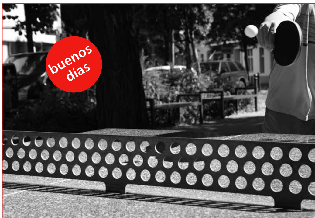
Tischtennis - nicht nur bei Windstille eine optimale Sportart für den Sommer