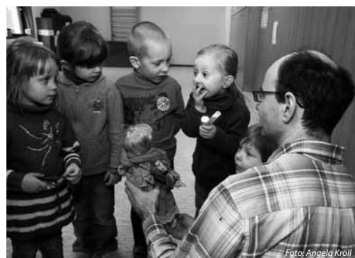
Lustig und neugierig, so sind die Kinder

den Rahmen für die Sprachförderung klar. In den 45 Minuten sind Bewegungsangebote, Auflockerungsspiele, Musik und Rhythmik ein wesentlicher Teil des ganzen Programms, um einen unverkrampften Weg zur Sprache zu bieten. Die verschiedenen Sinne sollen immer wieder angesprochen werden, da die Kinder so die Sprache besser aufnehmen.