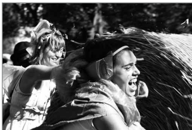
Rollen macht Spass und gibt Power

Auch abseits der Rollbahn ist mit Musik und Tanz für Unterhaltung gesorgt. In diesem Jahr findet das Fest wieder in Kooperation mit dem