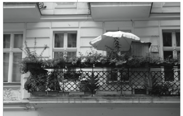
Balkone - ein Stück Lebenskultur

„Ich finde, wir hatten dieses Jahr schon einen tollen Sommer. Seit April gab es viele Sonnentage, die ich meistens dazu nutze, um mit meinem Fahrrad die Gegend zu erkunden. Je heißer es wird, umso besser, denn ich bin ein Wassermensch. Wir fahren in der Regel dann in das Umland von Berlin, wo wir schwimmen, paddeln oder einfach nur die Landschaft genießen. Mein Lieblingsplatz im Quartier, ganz ehrlich: mein Balkon.“