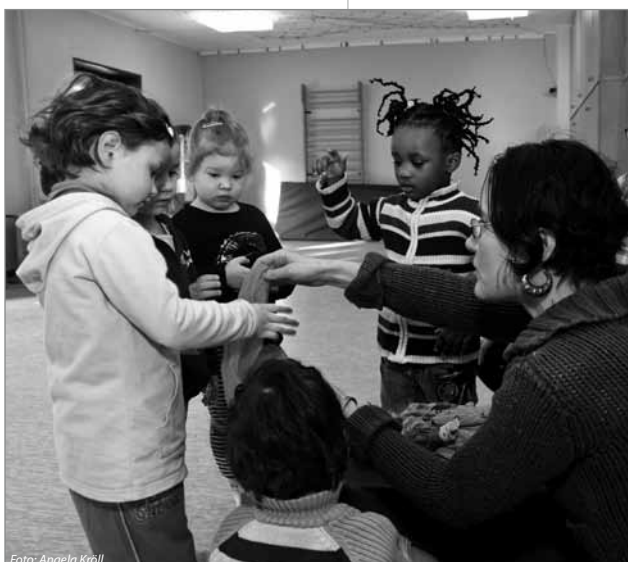
Begreifen und Begriffe bilden liegen nah beieinander