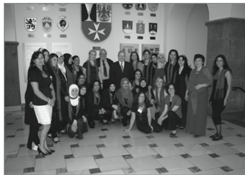
Gruppenbild mit zwei Herren: Die Zertifikatsfeier im Rathaus

31 erfolgreich ausgebildete Stadtteilmütter haben im festlichen Rahmen ihre Zertifikate im Neuköllner Rathaus überreicht bekommen. Damit können sie nun loslegen und vorrangig türkische und arabische Familien in den Neuköllner Quartiersmanagement-Gebieten besuchen und beraten.