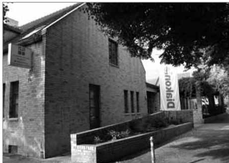
Gemeinsam Zeit verbringen: Haltestelle Diakonie

Die Haltestelle Diakonie Neukölln/Treptow mit ihrem Standort in der Kirchgasse 62; 12043 Berlin, sucht interessierte und engagierte Ehrenamtliche, die im Rahmen eines Besuchsdienstes und/oder einer Betreuungsgruppe Menschen mit Demenz und anderen psychischen Erkrankungen im Alter unterstützen möchten.