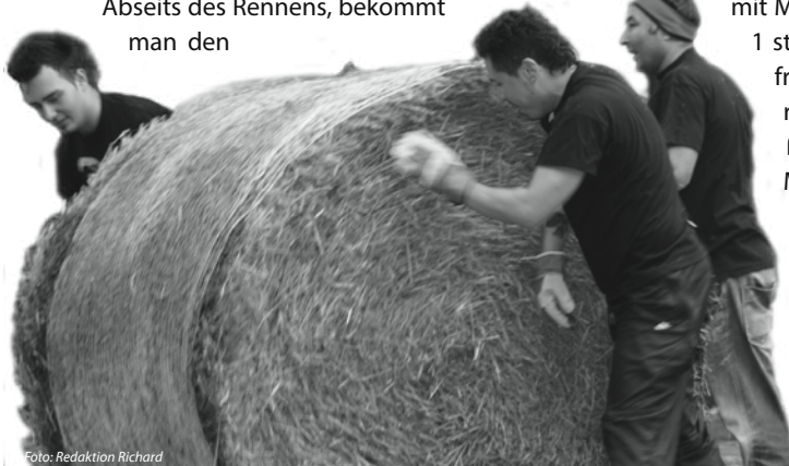
Richard Papa was a rolling stone: Die Vätergruppe