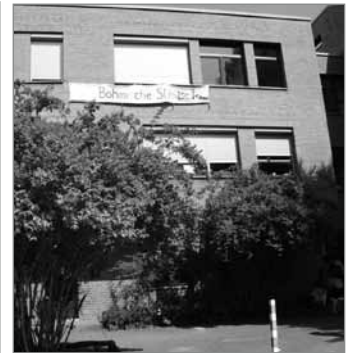
In der Kita freuen sie sich über Lesepatzen

Viel zu häufig bleiben die Talente von Neuköllner Kindern unerkannt. Die Bürgerstiftung Neukölln möchte daher mit ihrem Projekt „Neuköllner Talente“ unmittelbar Kinder zwischen 8 und 12 Jahren unterstützen. Ziel des von der Aktion Mensch geförderten Projekts ist es, Talente der Kinder – im Sinne von Gaben, Wünschen und Interessen – zu entdecken, aufzugreifen und mit Hilfe eines „Talentpaten“ zu fördern. An dem Projekt können sich Viele beteiligen. Ob Technik oder Kultur, Sport, Religion oder Naturwissenschaft: Kinder sind neugierig und haben eine Menge Fragen. Weitere Informationen: Website des Projekts „Neuköllner Talente“! http://neukoellner-talente.de/ Tel: 030/62738 014