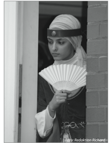
Die historische Modenschau verdeutlichte, dass sich Kleider und Leute wandeln.

Tatsächlich sind die kostümierten Menschen entweder Teil der historischen Modenschau, die auf dem Hof von Kutschen-Schöne mit Mitteln aus dem Quartiersfonds 1 stattfand oder eines Teams, das freiwillig über 200 Kilo schwere Strohhallen über die Straße rollte. Insgesamt traten 16 Mannschaften aus Neukölln, Zehlendorf und Usti nad Orlic an. Am Turnier mit den Jugendmannschaften waren immerhin vier Mannschaften am Start. Am Ende siegte wieder das Team aus der Tschechischen Republik, sie gewannen: Eine Reise nach Tschechien.