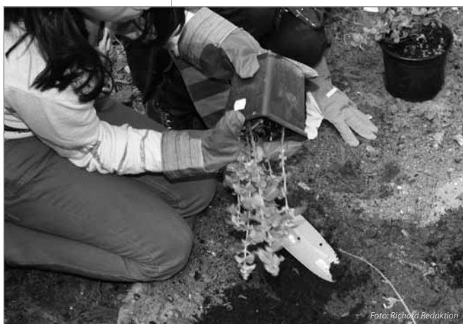
Jetzt wird gepflanzt!