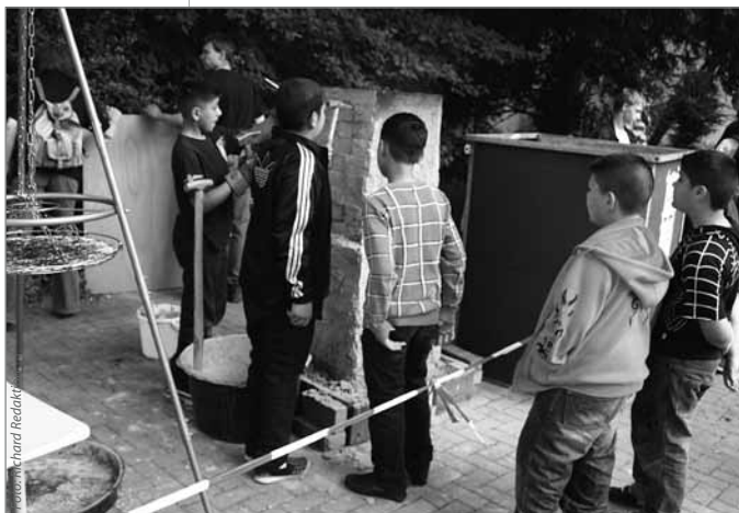
Jetzt wird der Ofen freigelegt

So gesehen sind die Schmiedekurse mit dem Bereich Arbeitslehre der Adolf-Reichwein-Schule und die Schmiedevorfürungen für Grundschüler der Richard- und Löwenzahn-Schule mehr als eine Ergänzung des Arbeitslehre- und Sachkundeunterrichts, sie bilden eine Brücke zwischen Vergangenheit und Zukunft.