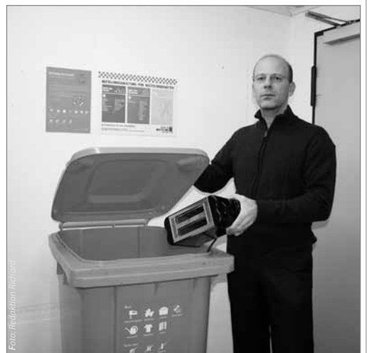
In die „Orange Tonne“ gehören auch kaputte Elektrogeräte.