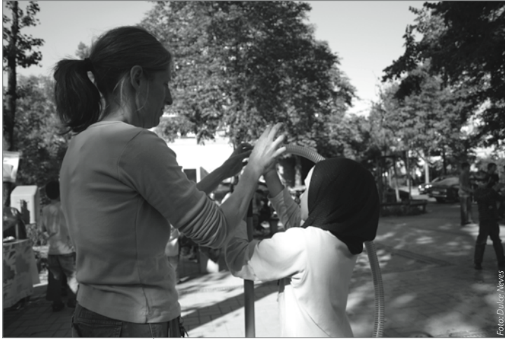
Gemeinsam bauen, spielen, feiern

Selbst für das leibliche Wohl war gesorgt; von dem über das Quartiersmanagement geförderten Projekt „Interkulturellen FrauenBio-Gesundheitsküche“ wurden vegetarische Stullen und Schnitten gereicht. So wurde an diesem Spätsommertag der Platz mit vielen Spielmöglichkeiten lebendig. Übrigens, das Boulespiel lässt sich das ganze Jahr über im Büro des Quartiersmanagements in der Böhmisches Str. 9 ausleihen.