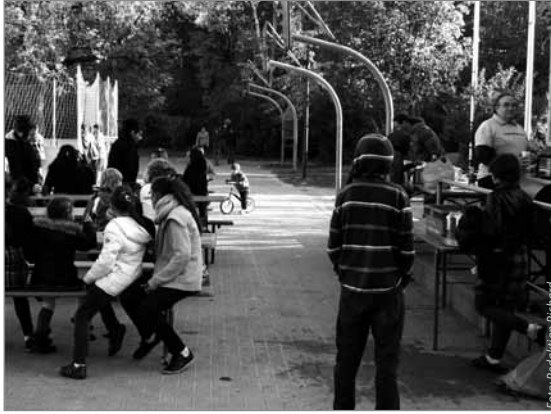
Zwischen den Spielen wird sich ausgeruht und gegessen

„Gute Verbindung zum Wettergott“, fasst Claudia Israel vom Kinderpavillon den großen Zulauf zusammen. Mit zwischenzeitlich gut 100 Kindern und Erwachsenen war am Samstag, den 22. Oktober wieder richtig etwas los auf dem Droryplatz. Gemeinsam mit verschiedenen Trägern und Einrichtungen aus dem Quartier wurde auf dem Hof der Löwenzahnschule das Herbstfest gefeiert. Allein 30 Teams nahmen am Fußballturnier teil,