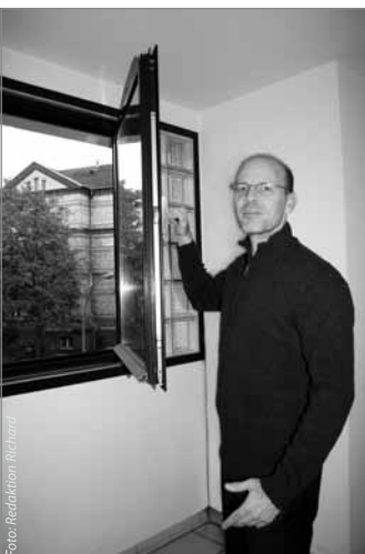
Lieber mal richtig lüften, als immer gekippt