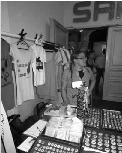
Shirts und Sticker: AHOJ! im Foyer des Heimathafen

Mode und Neukölln ist längst kein Gegensatzpaar mehr. 32 aus 50 Labels wurden von einer Jury ausgewählt, um sich beim zweiten Neu-