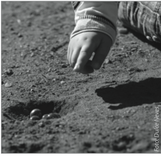
Das gute alte Marmelspiel