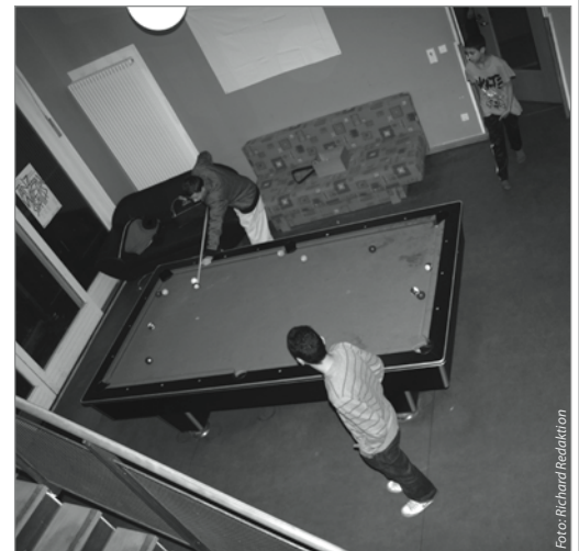
Der Billardtisch lädt zum Spielen ein

Die Theater-, Bewegungs-, Tanz- und Sportkurse üben eine besondere Anziehungskraft auf Kinder und Jugendliche aus. Diese Kurse finden unter qualifizierter Anleitung statt und werden aus dem Programm „Soziale Stadt“ geför-