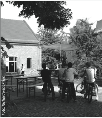
Auch im Sommer gibt es Aktion