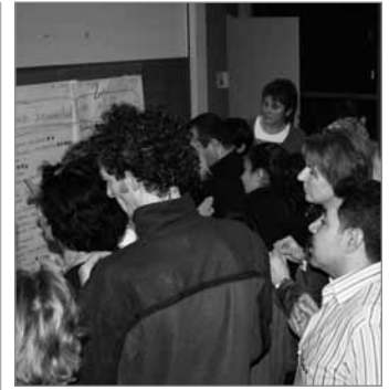
Jetzt wird abgestimmt!

Der nächste „Runde Tisch Grundschulen“ findet am 25. Januar 2012 von 16:30 Uhr bis 19:00 Uhr im Mehrzweckraum im Erdgeschoss der Löwenzahn-Grundschule statt. Alle Schülersprecher, Eltern, Lehr/innen, Erzieher/innen und Sozialarbeiter/innen der beiden Schulen sind herzlich eingeladen.