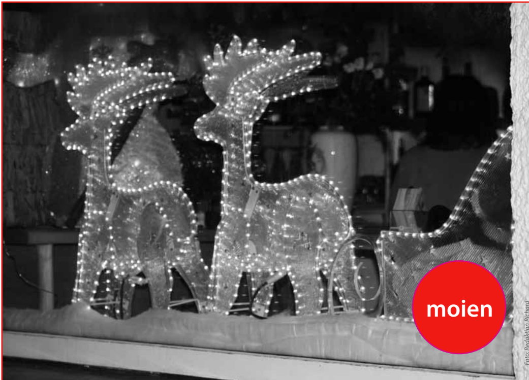
Außergewöhnliche Transportmittel in einer außergewöhnlichen Zeit!