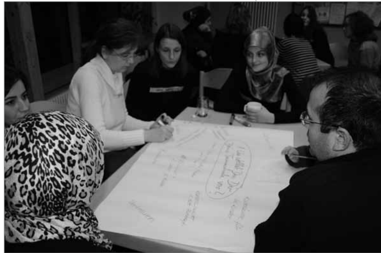
Hier werden viele Ideen für die Schulen gesammelt