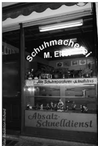
Meister Elter in der Mareschstraße