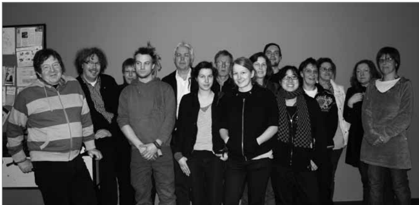
Dies waren 2010 die Mitglieder des Quartiersrat, jetzt wird neu gewählt

In seiner sechzehnten Sitzung ging es vorrangig um das Handlungskonzept 2011, die Abstimmung über das QF2-Projekt „Mieterberatung für Quartiersbewohner“ und die Quartiersratswahl 2012. Das QM-Team berichtete zu Beginn über aktuelle Entwicklungen und anstehende Veranstaltungen im Richardkiez. So wies das QM-Team auf die Situation des Spielplatzes an der Saalestraße / Ecke Zeitzer Str. hin. Im weiteren Verlauf stellte das QM-Team die Ausrichtung des neuen Handlungskonzeptes 2011 vor. Die generelle Grundlinie des diesjährigen Handlungskonzeptes entspricht weitgehend dem vorhergegangenen. „Bildung“ bleibt nach wie vor das wichtigste Handlungsfeld. Auch die Schwerpunkte „Fort- und Weiterbildung“ und „Partizipation der Bewohner und Akteure“, eng verwoben mit dem Schwerpunkt „Integration“ werden weiter hoch gewichtet. Die Schwerpunkte „Mehr Chancen auf dem Arbeitsmarkt“, „Wohn- und Lebensraum“, „Stadtteilkultur“