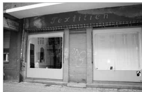
mittlerweile wieder Heimstatt, auch für Textilien

Nutzer der Räumlichkeiten ja fest, dass sich ein längerfristiger Mietvertrag doch lohnt, auf jeden Fall beleben sie den Kiez und bringen ihre Ideen mit ein. Die Interessenten bekommen durch die Zwischennutzungsagentur Unterstützung bei den Verhandlungen mit dem Eigentümer. Kleine Vereine, Gewerbe-neugründungen oder Künstler