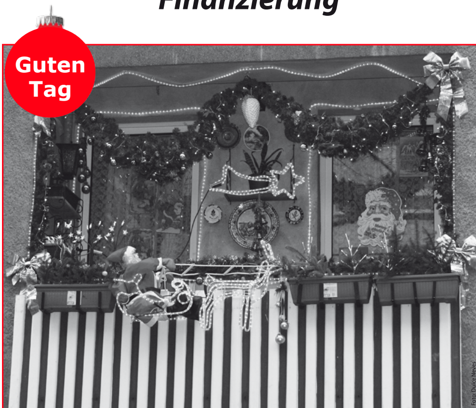
Das Weihnachtsfieber ist im Richardkiez ausgebrochen. Ob es ansteckend ist, sehen Sie selbst.

Vermieten auf Zeit Kunstfabrik sucht Neuköllner Geschichten.