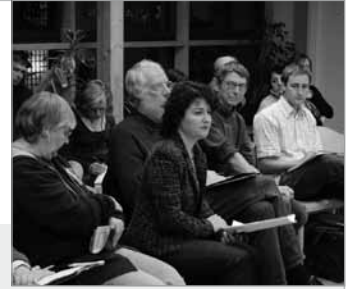
Zuhören als Grundlage für Verständnis