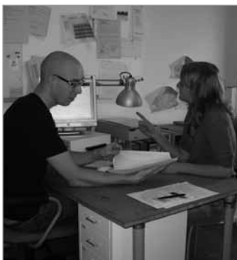
Recherche und Beratung