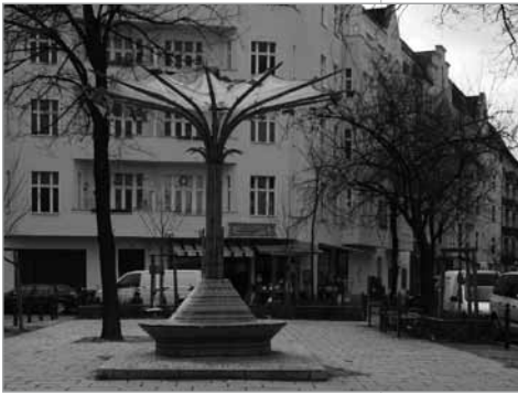
Der Treffpunkt im Kiez

Antragsberechtigt sind alle Bewohnerinnen und Bewohner sowie andere Kiezakteure, also Vereine, Schulen, Kitas u.v.m. Aus den Mitteln des QF 1 können Projekte mit einem Volumen von max. 1.000 Euro beantragt, bewilligt und gefördert werden. Für das Jahr 2010 stehen uns voraussichtlich wieder 15.000 Euro zur Verfügung.