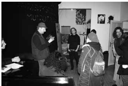
Stelldichein bei „exilien“