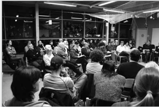
Interesse und Respekt: Gemeinsam diskutieren