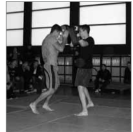
Jiu Jitsu ist auch eine Kunst