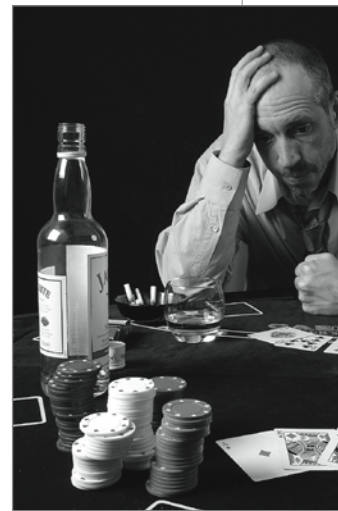
Ein glücklicher Mensch sieht anders aus.

sind Suchtmittel, deren natürliche bzw. chemische Substanzen mehr oder weniger langfristig psychisch und meist auch körperlich abhängig machen. Es gibt legale Drogen wie Alkohol, Zigaretten und Medikamente, die abhängig machen, sowie illegale Drogen wie zum Beispiel Cannabis in Form von Haschisch oder als Marihuana, Ecstasy (Amphetamine), Heroin (Opiate), Kokain usw. Illegal sind diese Drogen, weil ihr Besitz und ihre Weitergabe bzw. ihr Verkauf nach dem Betäubungsmittelgesetz strafbar sind. Die anderen Süchte kennen wir auch, sie sind aber weniger unser Themengebiet.