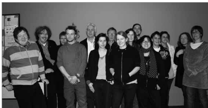
Mitglieder des Quartiersrats bei der konstituierenden Sitzung im Januar 2010

Die Aufgaben des Quartiersmanagements (QM) und die konkrete Stadtteilarbeit im Gebiet Richardplatz Süd wurden durch das QM-Team vorgestellt. Die wichtigsten Schwerpunkte der QM-Arbeit liegen auf den Themen Bildung, Arbeit und Integration. Das QM ist in seiner Arbeit auf die Kooperation mit öffentlichen Bildungseinrichtungen, seinen „starken Partnern“, angewiesen. Grundlage der