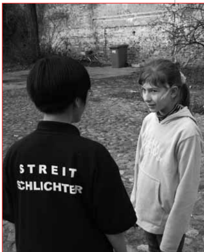
Zwischen wem schlichtet dieser junge Mensch?

Alles begann im Quartiersbüro bei einem Treffen der Initiatoren des Projektes mit den Leitern der 4 Schulen des Quartiers: Richard- und Löwenzahn-Grundschule, Röntgen- und Adolf-Reichwein-Schule. Die Schulleiter verdeutlichten, dass dringend etwas getan werden müsse, um dem hohen Konfliktpotenzial an den Schulen und im Umfeld entgegenzuwirken. Alle wünschten sich sowohl ein Training für Schüler als auch Unterstützung für Lehrer und Erzieher im