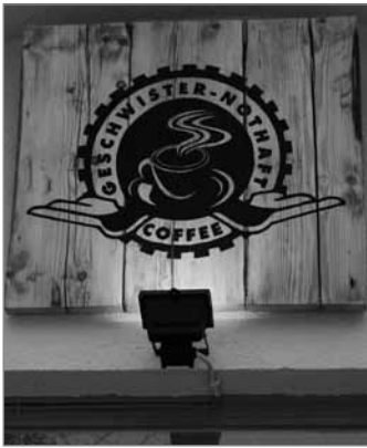
Ein breitgefächertes Angebot

Geschwister Nothaft Coffee Schwarzastr.9 am Siegfried-Aufhäuser-Platz, S-Bhf Sonnenallee