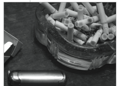
Rauchen und riechen, kein gutes Paar