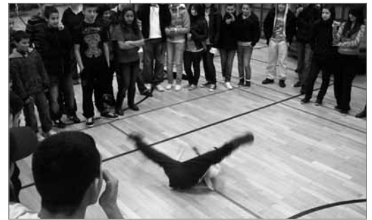
Akrobatik und Aktion: Breakdance