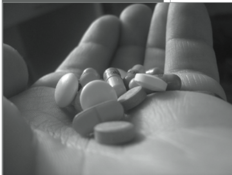
Auch Medikamente können süchtig machen

Als Diplom Verwaltungswirt hat er eine klassische Verwaltungslaufbahn absolviert und war dabei im Sozialamt, dem Jugendamt und beim JobCenter tätig.