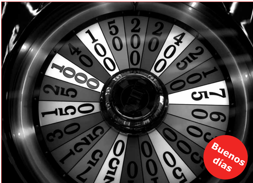
Der vermeintliche schnelle Weg zum Glück ist meist eine Abwärtsspirale