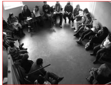
Der Kreis: Ritual und Versammlungsform

Von 2006 bis 2009 lief das Projekt „Gewaltprävention im Stadtteil“. Genau betrachtet handelt es sich dabei um zwei Teilprojekte. Einerseits um die Gewaltprävention an Schulen und andererseits um die Streitschlichtung im Kiez. Möglich wurde das Projekt durch Fördergelder des Programms „Soziale Stadt“. Mit verschiedenen Initiativen wurde dazu beigetragen, dass mehr Konflikte konstruktiv und ohne Gewalt gelöst werden. Einsicht und Dialog, anstelle des Faustrechts, war die Botschaft. An den Schulen gab es folgerichtig Ausbildungen zum Streitschlichter (Konfliktlotsen), Soziales Kompetenztraining und Beratung für Lehrer/-innen. Auch in der Nachbarschaft geht es um die Bearbeitung von Konflikten. Hier half die Schulung von so genannten Kiezmediatoren. Mit dem „Mediationsbüro Mitte“ wurde ein Träger beauftragt, dabei die Starthilfe zu geben, damit die Maßnahmen zur Gewaltprävention auch nach dem Auslaufen der Förderung selbständig weiterbetrieben werden.