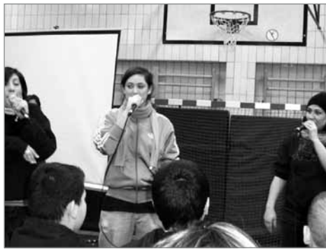
Hip-Hip und Girlpower: TFS-Junior

Highlights waren die Live-Shows der Streetdance-Mädchen, die Jiu-Jitsu-Choreografie der beiden Jungs, wie auch das Konzert der TFS-Junior. Bei den Konzerten der Gäste, den „Too Funk Sistaz“ und von „Mr Billyhancock“ wirkten