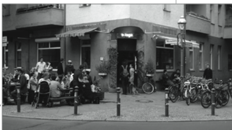
Die B-Lage bei gutem Wetter

Aktuelle Termine und Veranstaltungen finden sich auch unter: www.b-lage.de