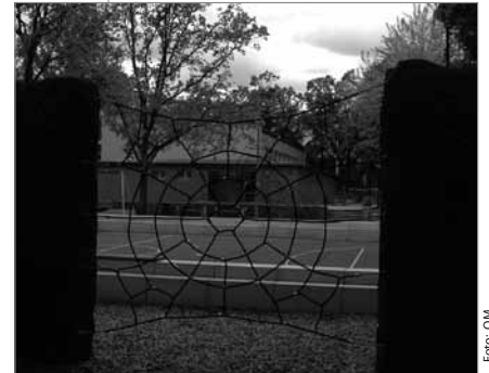
Beim Umbau wurden die Hilfen gut verknüpft