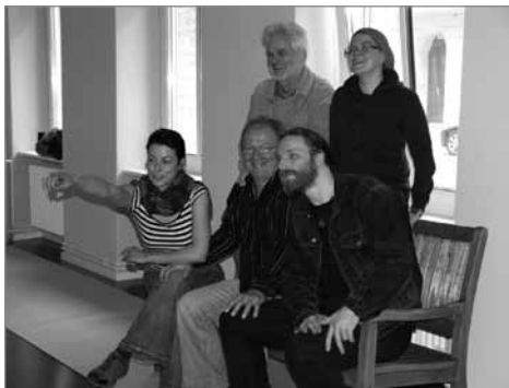
Das gesamte Team der Kreativen Gesellschaft Berlin