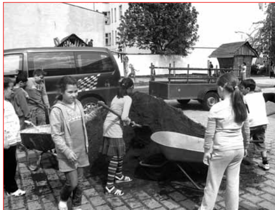
Umweltbildung sehr konkret: Erde wird umverteilt

Die Schulgärten sollen auch nach Ende des Projektes weiterlaufen. Hausmeister, Lehrer und natürlich die Kinder selbst sollen die Gärten betreuen. Dafür sind natürlich einige Vorbereitungen notwendig. Pflegepläne müssen erstellt