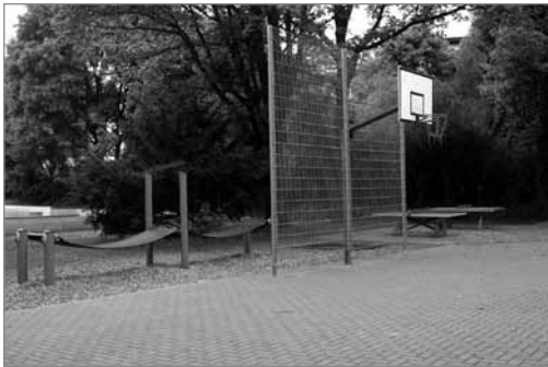
Diverse Sportangebote bereichern den Schulhof

Was lange währt, wird endlich gut! Genutzt wird der Sport- und Spielschulhof der Adolf-Reichwein-Schule bereits – die Schülerinnen und Schüler waren nicht davon abzuhalten! Nach dem Baubeginn in den Sommerferien des letzten Jahres unterbrach der harte Winter jede Arbeit,