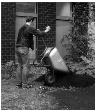
Hier entsteht ein Beet

Projektmittel aus dem Programm „Soziale Stadt“: für das Jahr 2010 insgesamt 10.000 Euro.