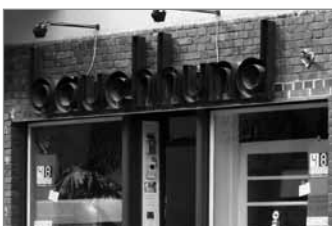
Salonlabor von außen, was ist innen?

Informationen über das Kunst- und Kulturfestival 48 Stunden Neukölln: www.48-stunden-neukoelln.de oder am Infopoint in der Hertzbergstraße 1