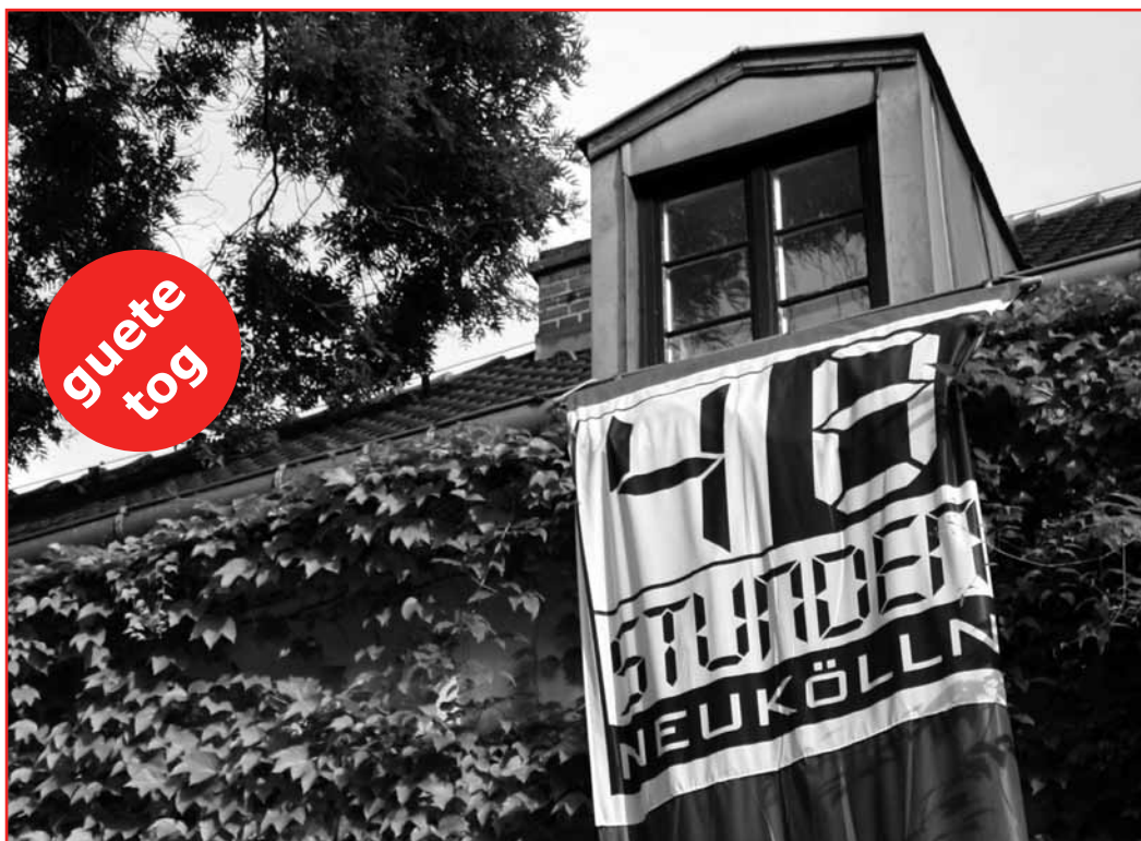
Die Fahne ist ausgerollt, das Programm geschrieben, jetzt freut sich Rixdorf auf seine Besucher.