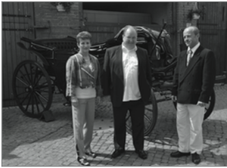
Die Geschwister mit dem Bürgermeister