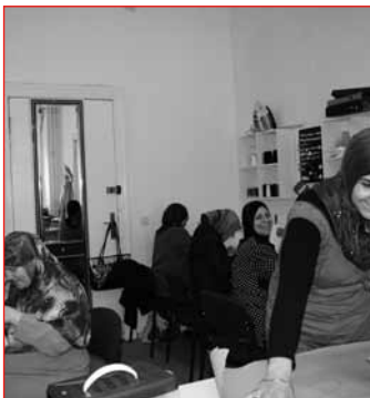
Miteinander nähen, lachen und leben