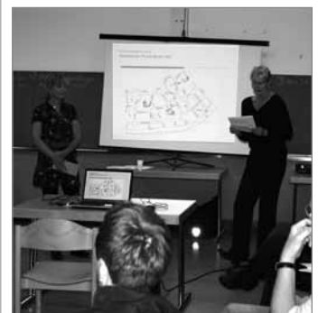
Die Diskussion ist eröffnet

im Oktober 2010 findet nach 2 jähriger Legislatur die letzte Sitzung der Vergabejury statt. Anfang 2011 wird die Vergabejury neu konstituiert. Falls Sie Interesse an einer Mitarbeit haben, hätten Sie am 21. Oktober 2010 ab 18.00 Uhr die Gelegenheit an der öffentlichen Sitzung der Vergabejury teilzunehmen. Die Sitzung findet im Quartiersbüro in der Böhmisches Str. 9 statt. Wir freuen uns auf Sie. Sollten Sie dazu noch Fragen haben, stehen wir gerne zur Verfügung. Ihr Quartiersmanagement-Team.