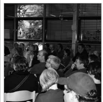
Eine aktive Zuhörerschaft