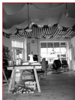
Das Werkstudio in seiner Weite

Für manche der Frauen ist das Näh & Werk Studio zum Arbeitgeber geworden. Denn an das Nähstudio ist seit 2009 eine Zwischenmeisterei angeschlossen. Für die Kunden, meist Berliner Jungdesignerinnen, werden nach deren Entwürfen Kollektionen in kleinen Stückzahlen hergestellt.