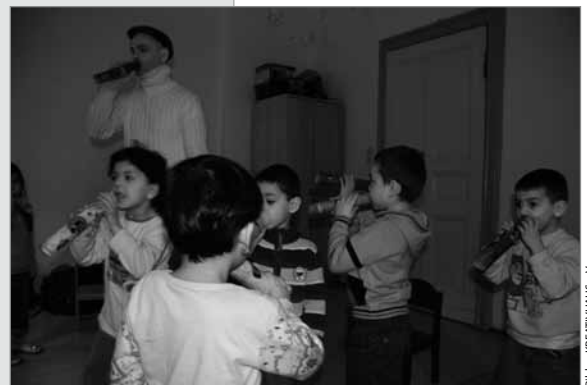
Egal ob Mikro oder Trompete: Hier werden Töne erzeugt

Die Sprachvermittlung funktioniert dabei oft nach dem Prinzip „ Ich greife, ich begreife – (ich habe einen Begriff)“.