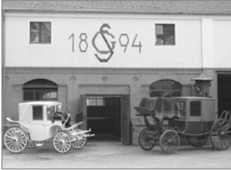
Die Kutschen kennt man am Richardplatz