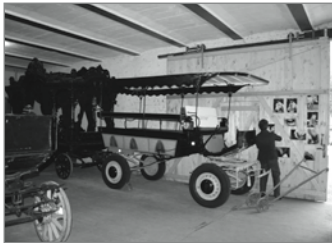
Innen gibt es noch mehr zu bestaunen