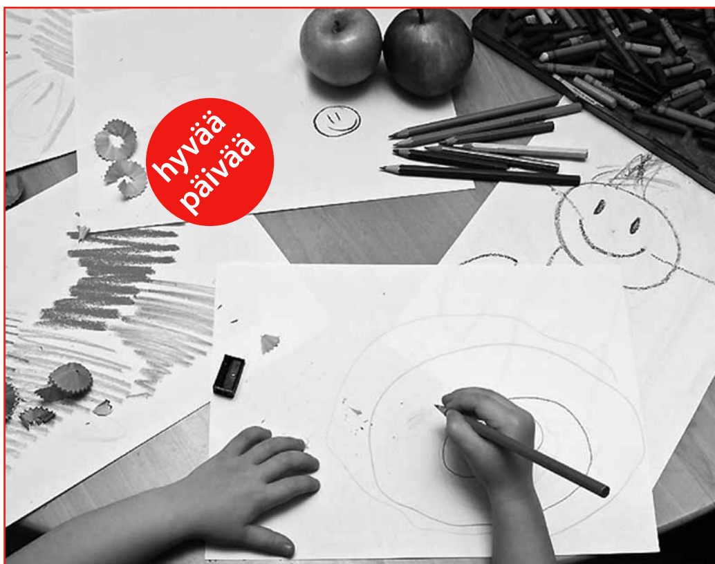
Kinder brauchen sinnvolle Angebote, aktiv sind sie ohnehin