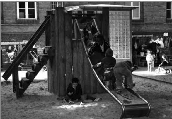
Spaß in der Kita „Du & Ich“