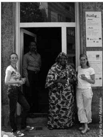
Das Studio: Ein Ort der Begegnung