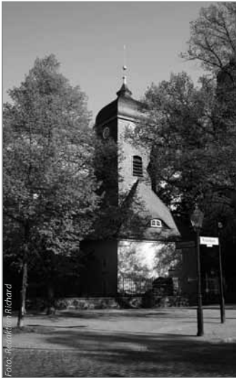
Die Bethlehemskirche am Richardplatz

Obwohl ungefähr 60 Prozent der Berliner konfessionslos sind, spielt das Thema Religion und religiöse Gemeinden gerade im Richardkiez eine wichtige Rolle. Zum einen gibt es die historische Komponente der Glaubensflüchtlinge, zum anderen bilden die Gemeinden heute einen wichtigen Eckpfeiler für soziale Arbeit im Kiez. Im Schwerpunkt werden die kulturellen und sozialen Aktivitäten dargestellt. Zugleich möchten wir aber auch der Frage nachgehen, wie es um den Dialog der Religionen bestellt ist?