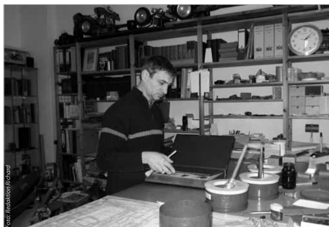
Handwerk als angewandte Kunst