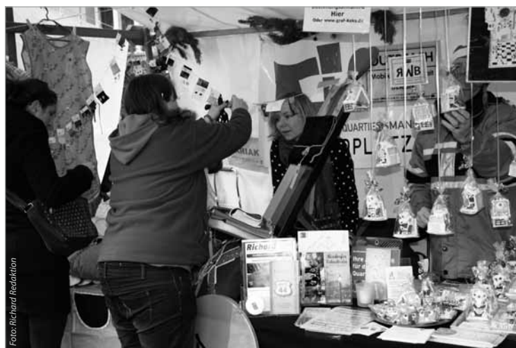
Gemeinschaftsstand der diversen Initiativen rund um das Näh- &amp; Werkstudio auf dem Markt