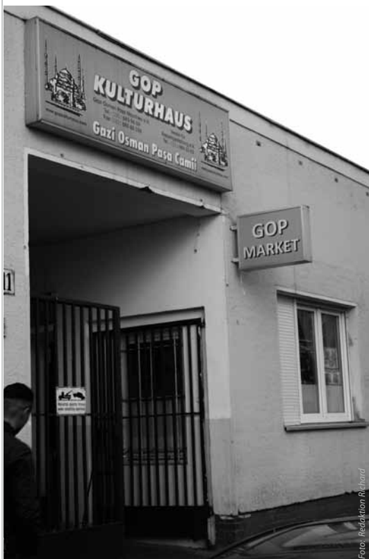
Das Tor ist offen für Besucher: Gazi Osman Pasa Moschee