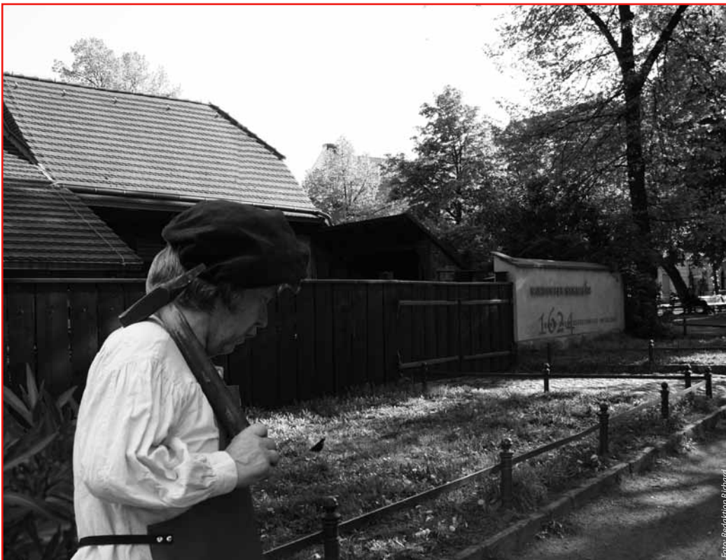
Auf dem Weg, damit der eigene Glaube gelebt werden kann: Böhmisches Glaubensflüchtlinge in Rixdorf