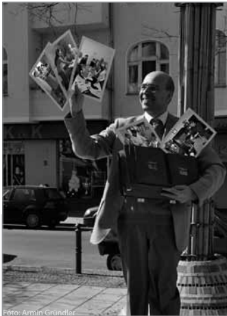
Ein breitgefächertes Angebot