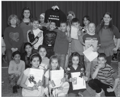
Die erfolgreichen Schlichter

Mit Ferienbeginn wurde am Freitag, den 3. April, die Stafette weitergegeben an die neuen Streitschlichter der Löwenzahn-Grundschule. 15 Schülerinnen und Schüler der vierten Klasse werden die nächsten 2 Jahre als Streitschlichter an der Schule aktiv sein. Seit zwei Monaten schauen diese ihren Vorgängern bereits über die Schultern. Jetzt überreichte jede/r Streitschlichter/in einem/einer Nachfolger/in ein Zertifikat und eine Rose. Viele Eltern und Geschwister begleit-