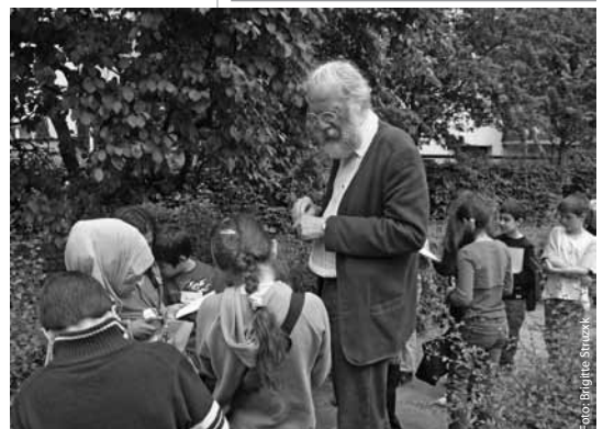
Der Garten wird erkundet