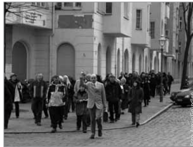
Steinle auf Protestmarsch?

Mittwoch, 27. Mai; Donnerstag, 18. Juni; Mittwoch, 24. Juni und Mittwoch, 15. Juli.