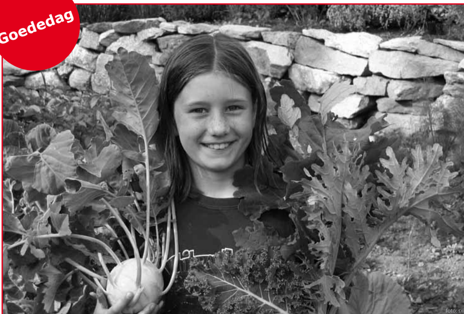
Gemüse in der Hand, ein Lächeln im Gesicht - Ausnahme oder Regel?