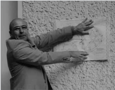
Blick auf den Rundgang

Das Projekt ist Teil des Handlungsschwerpunkts „Lokale Ökonomie“. Es wird mit 3.000 Euro im Jahr 2009 aus dem Programm Soziale Stadt vom Quartiersmanagement Richardplatz Süd gefördert.