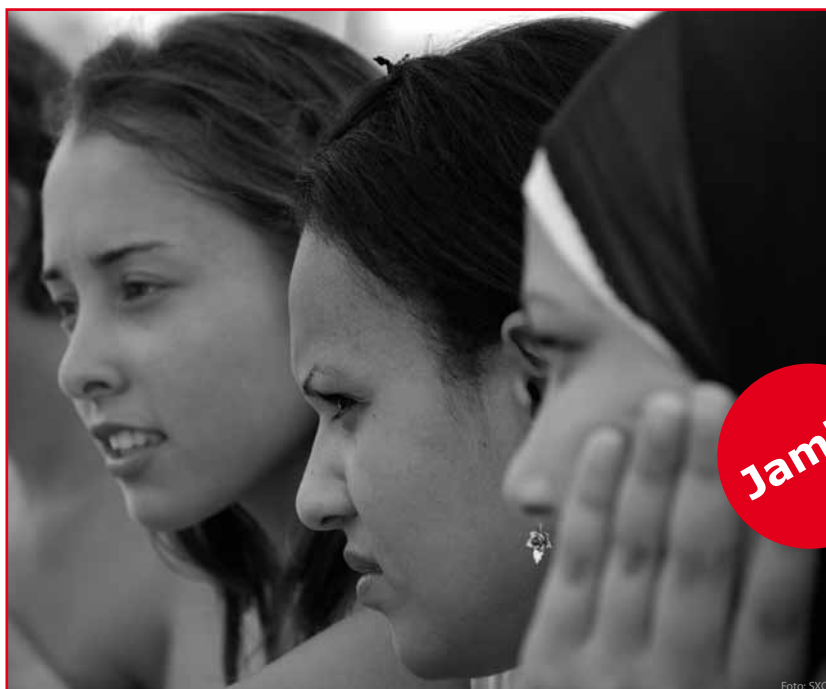
Sich wohlfühlen mit neuen Freunden