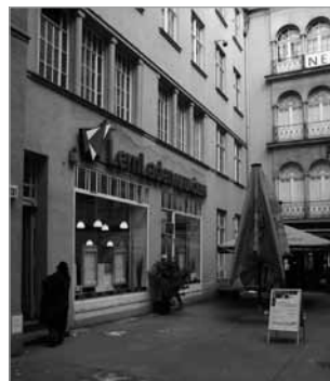
Nebenan findet man den Lernladen

Der wirtschaftliche Strukturwandel hat auch in Neukölln seine Spuren hinterlassen. Viele Unternehmen, große Industrieunternehmen, sind nicht mehr hier ansässig. Aber dennoch, wir haben uns 2002 ganz bewusst für den Standort mitten in Neukölln entschieden: Der Stadtteil ist bunt und dynamisch. Hier treffen Menschen mit den unterschiedlichsten Lebensläufen und Lebensentwürfen aufeinander. Das sehen wir als Herausforderung und Chance an.