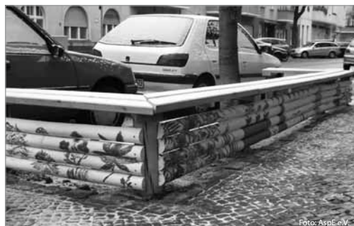
Wenn es wieder wärmer ist, dann lässt es sich hier gut sitzen.

Seit Mitte Dezember laden Sie, liebe Leser, drei farbenfrohe Baumumzäunungen mit Sitzfläche zum Verweilen ein. Für mehr Lebensqualität, Müßiggang und Nachbarschaftlichkeit befinden sie sich vor dem „Kiezcafé“, der Physiotherapiepraxis von Kula und der Ambulanten sozialpädagogischen Erziehungshilfe (AspE e.V.). Elf Kinder und vier Pädagogen von AspE in der Brusendorfer Str. 20, starteten am 1. November in Kooperation mit