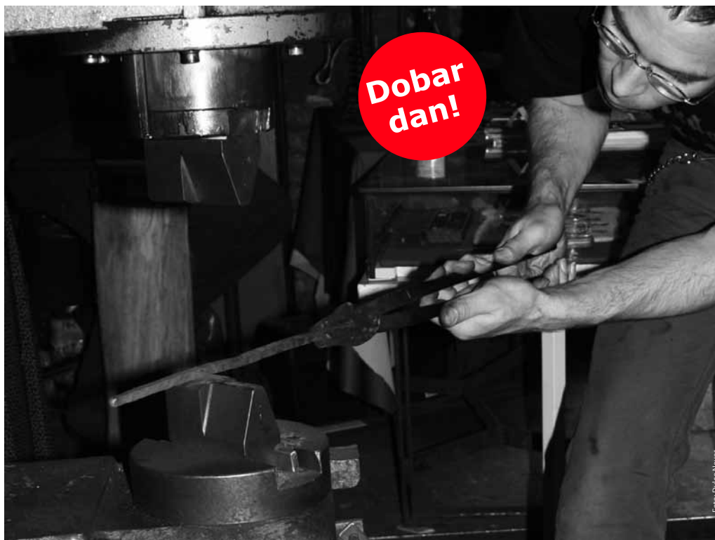
Klassisches Handwerk, wie hier in der Schmiede, findet sich noch im Richardkiez.