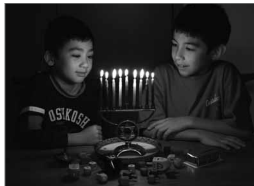
Auch hier wird gespielt

An Chanukka feiern die Juden die Einweihung des wiedereröffneten zweiten jüdischen Tempels in Jerusalem im Jahr 164 v. Chr. Der Makkabäeraufstand befreite Judäa von der Oberherrschaft des Seleukidenreiches, einem Nachfolger des Reiches von Alexander des Großen. Der Aufstand richtete sich auch gegen bereits hellenisierte Juden. Der Altar des griechischen Gottes Zeus wurde aus dem Tempel entfernt und der jüdische Tempeldienst wieder aufgenommen. Mit der Menora wurde ein Leuchter aufgestellt, der nie erlöschen sollte. Es gab in Jerusalem aber nur noch geweihtes Öl für einen Tag. Um neues Öl herzustellen, hätten die Bewohner Jerusalems jedoch acht Tage gebraucht. Nach jüdischer Überlieferung brannte der Leuchter durch ein Wunder mit dem vorhandenen Öl acht Tage lang, bis neues hergestellt war. Chanukka findet daher an acht Tagen statt. Am Abend versammelt man sich mit Familie und Freunden zum fröhlichen Feiern. Kinder bekommen Süßigkeiten und Geschenke. Dieses Jahr begann das Chanukkafest am 2. Dezember.