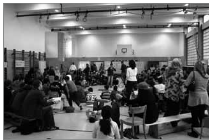
Kunterbunte Beteiligung, um den Bedarf zu ermitteln

Was machen die Kinder im Richardkiez in ihrer Freizeit? Obwohl es einige Angebote im Kiez gibt, verbringen zu viele von ihnen ihre freie Zeit immer noch mit Computerspielen oder auf der Straße. Leider haben auch die Schulen nur wenig Geld, um ein umfangreiches