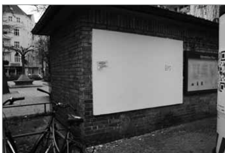
Die Pinnwand ist nun da, nutzen Sie sie!

zu wollen. Das Tiefbauamt wird mit der Zeit den Weg neben dem Baum ausglätten.