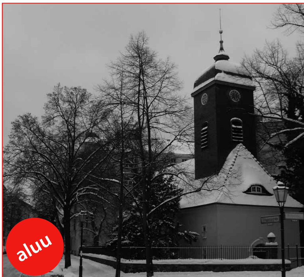
Rixdorf im winterlichen Gewand, jetzt kommt Weihnachten