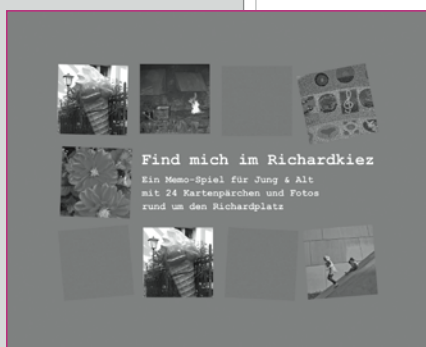
Unser Geschenkipp für Weihnachten - Das Memo-Spiel

Das Projekt wird vom Quartiersmanagement Richardplatz Süd aus Mitteln des Programms "Soziale Stadt" finanziert.