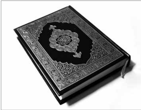
Der Koran als Grundlage des Islam

theistischen Religionen. Nach der bestandenen göttlichen Probe opferten Ibrahim und Ismael einen Widder, daher sollen gläubige Muslime zur Feier des Festes ein Tier opfern. Das Fleisch des Tieres soll auch unter den Armen und Hungrigen verteilt werden. Dieses Jahr feierten die meisten Muslime das Opferfest zwischen dem 16. und 19. November.