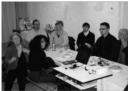
Trotz ernster Themen, hier wird auch gelacht.

ratend zur Seite stehen können. Auch die Weiterführung des „Rixdorfer Ruf“ durch Gewerbetreibende nach dem Auslaufen der Förderung durch „Soziale Stadt“ wurde angedacht.