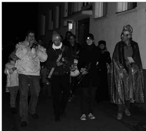
Beim musikalischen Umzug im Dunkeln wurde auch musiziert

„Wir haben im November schon unser Opferfest gefeiert. Gemeinsam mit meiner Frau, meinem Sohn und meiner Tochter haben wir ein schönes Familienfest verbracht. Jetzt muss ich wieder viel arbeiten, denn in unserem Restaurant werden viele Weihnachtsfeiern veranstaltet.“