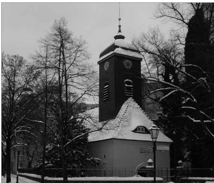
Die Bethlehemskirche am Richardplatz

Weihnachten ist ein Feiertag geworden, der viele Facetten hat. Ursprünglich feiern die Christen die Geburt von Jesus Christus – Gottes Sohn. Als kirchlicher Feiertag ist der 25. Dezember erstmals im Rom des Jahres 336 belegt. Der Begriff Weihnachten entstand im Hochmittelalter, die genaue Herkunft des Wortes ist aber nicht geklärt. Übrigens spielt Jesus auch im Koran eine Bedeutung, wenn auch als Prophet und nicht als Sohn Gottes. Weihnachten ist aber nicht mehr nur ein rein religiöser Feiertag. Viele, die sonst kaum oder gar nicht in die Kirche gehen, feiern ihn trotzdem als größten Feiertag im Jahr, bei dem die ganze Familie zusammenkommt.